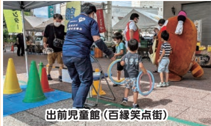
出前児童館 (百縁笑点街)