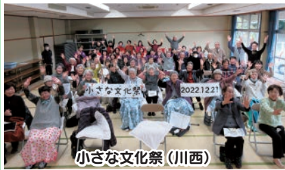
小さな文化祭 (川西)