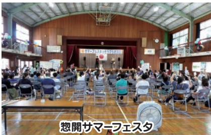
憩開サマーフェスタ