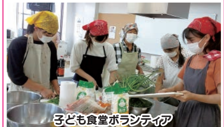
子ども食堂ボランティア